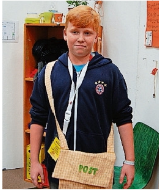
Bei der Post kann man Postbote werden.

Wenn du bei der Post arbeitest, kannst du eine Ausbildung als Postbote machen. Es gibt dafür einen extra Fachmann, welcher dir dann alles erklärt, was zutun ist: Als erstes werden dir vier Blätter zum Ausfüllen gegeben. Dort stehen verschiedene Rätsel zu den Spielständen, welche du richtig lösen musst. Um zu testen, dass du auch weißt, wo die beschriebenen Sachen zu finden sind, musst du dir einen Stempel abholen. Um diese Ausbildung abzuschließen, musst du kein bestimmtes Alter erreicht haben.