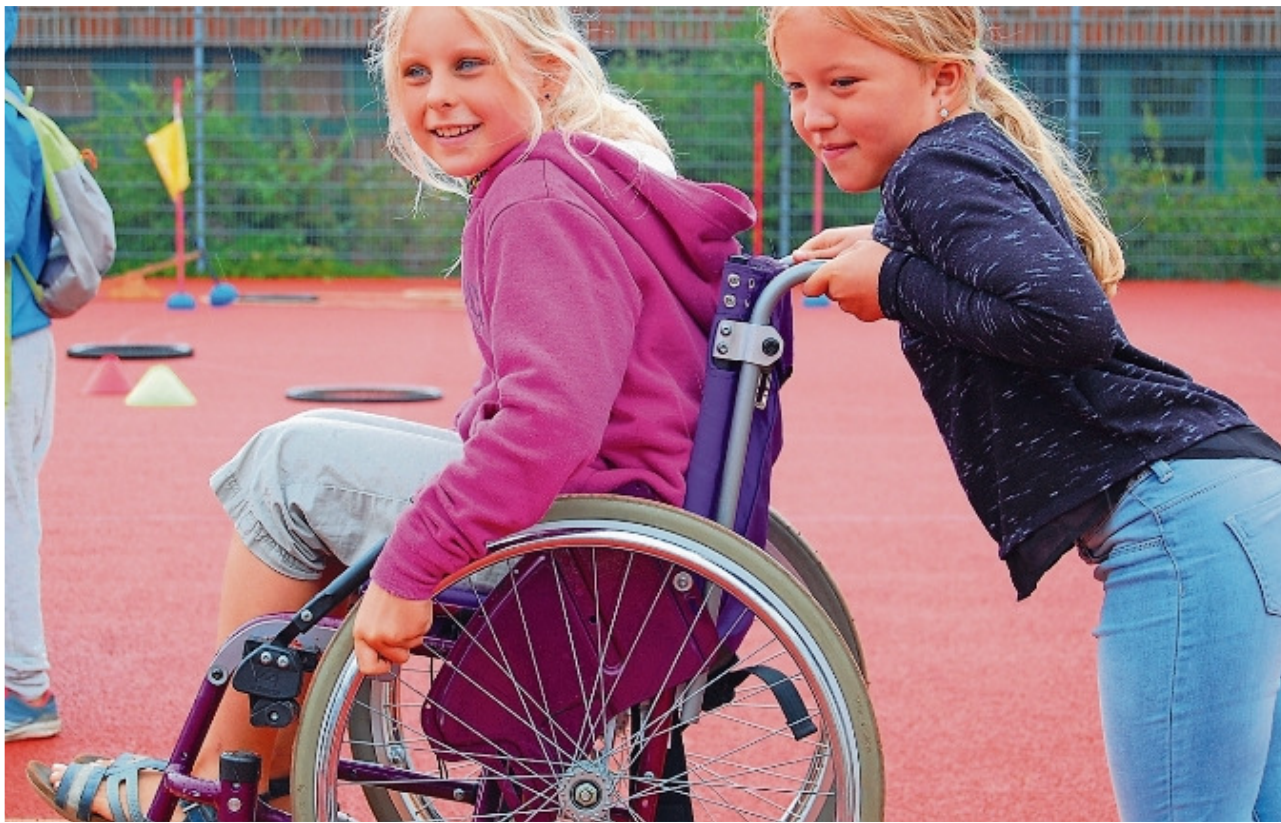
In der Inklusionsagentur können die Mini-Regensburger Inklusionshelfer werden.

Leider darf der Song nur einmal am Tag gespielt werden, was vom 1. Bürgermeister beschlossen wurde, da es Leute gibt, die mittlerweile von dem Song genervt sind. Tara (12)