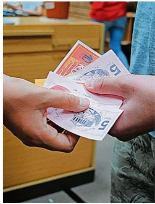
Geld ist wichtig in Mini-Regensburg.

REGENSBURG. Alles dreht sich in Mini-Regensburg um die Ratiserl, unsere Währung. Das Design wird immer wieder neu von Kindern der achten Klasse entworfen. Es sind natürlich nie die gleichen Kinder, sondern einmal Achtklässler aus der einen Schule und das andere mal aus einem ganz anderen Ort. Gedruckt werden die Scheine in der Stadtdruckerei und dann vor Ort geprägt und gestempelt. Der Name „Ratiserl“ kommt nicht von den Radieschen oder von den Ratten, sondern vom lateinischen „Ratisbona“, was „Regensburg“ bedeutet. Wahrscheinlich haben sich viele von euch schon mal gefragt, wie viele Ratiserl ein Euro sind. Wir haben recherchiert und sind auf ca. 13-16 Ratiserl gekommen. Ein paar von euch werden sich sicher wundern, warum wir einen 6-Ratiserl-Schein haben. Das kommt davon, dass wir das sechste Mal Mini-Regensburg haben.