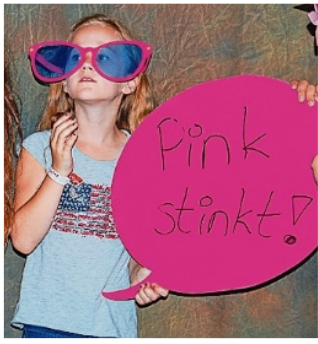
Viel Spaß beim Foto.